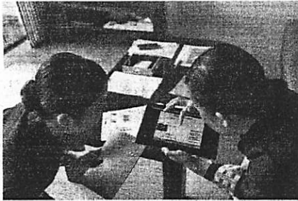
「界 加賀」の従業員はタブレットを見ながら動作を確認する